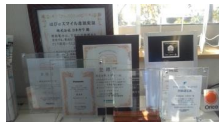
安心と信頼の証しです(^ ^)

明日香村(本社)と檀原市の香具山のそばで、電気・水道を始めとしたお家のこと全般をお手伝いする、地域密着型の会社です。お客様に安心してお任せいただけるよう、会社全体で努力向上を掲げ、“TOTORIモデルクラブ檀原店会”や“関西電力はぴeスマイル店”など、色んな認定をいただいています。