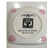
ヨネカワスタッフが作成しました(^ ^)

仮装してご来場いただくと、お楽しみがあるかも♪スタッフ一同、心よりお待ちしております。